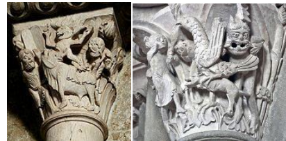
Moisés y el Becerro de oro, El Rapto de Ganimedes de la Basílica de Vezelay