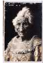
Wa Ha Gunta