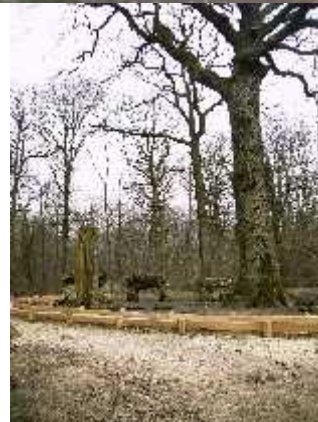
Fotos antiguas del Centro Druida en el Bosque de Meudon. Las piedras ya han sido retiradas y apiladas en otro lugar del bosque para evitar las ceremonias que se celebraban en el sitio.